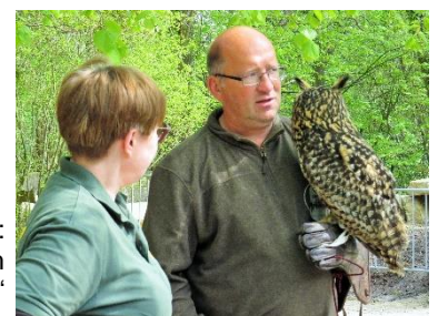
Rechts: Fachsimpeln mit dem „Eulenmann“