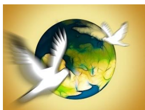
Frieden auf der ganzen Welt

Häufig geäußertes Wunsch der Kinder am Stand des Fördervereins: