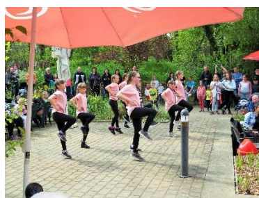
Links: Tanzmäuse in Aktion

Kontakt zu den Herausgebern: info@zoofreunde-aschersleben.de