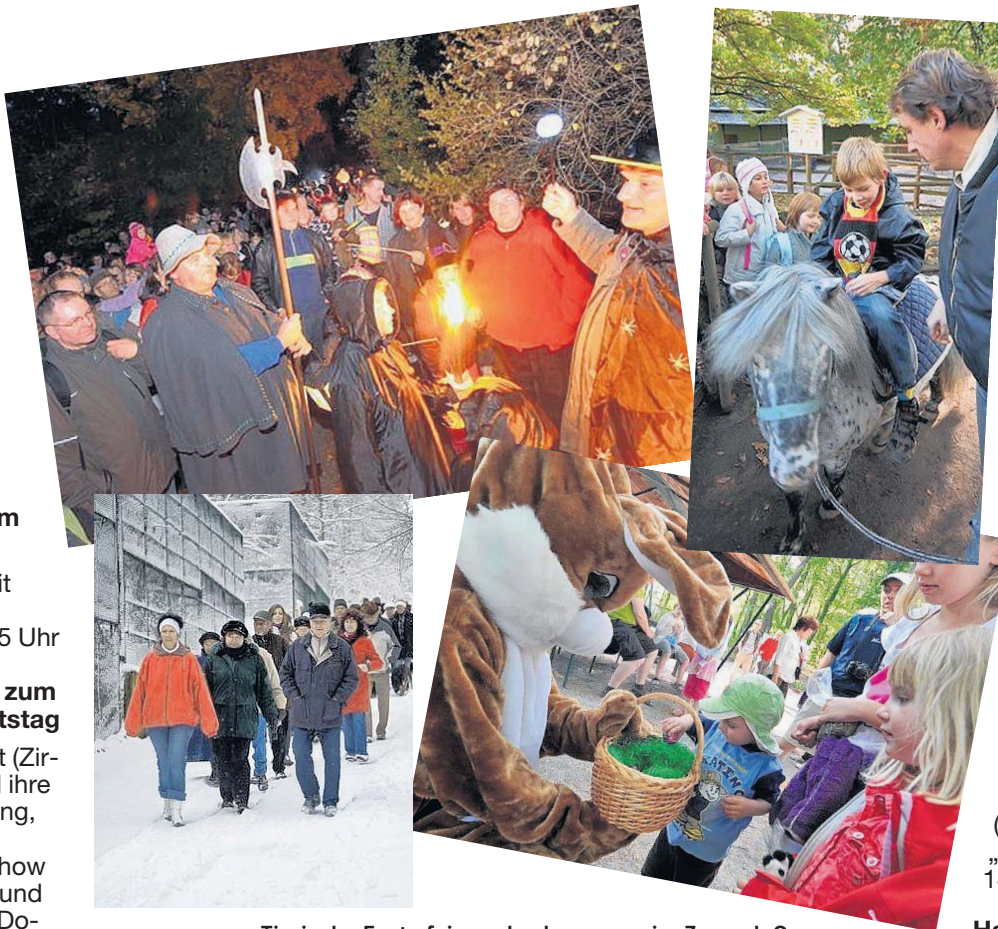
Tierische Feste feiern, das kann man im Zoo - ob Ostern, Geburtstag oder Halloween. Auch der Kalender für 2012 ist wieder prall gefüllt.

Die genauen Programmabläufe der einzelnen Veranstaltungen werden rechtzeitig bekannt gegeben.